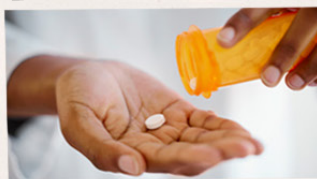
The medications have minimal side effects.

Quam nis nonsecte er sed do corem velesed deliquat velesequatum vel utat nissisi sissequi bla adionest tat illit irillan exero do eumsandiam, suscidunt lore modo odo cor sit lam ent tat laoreet erostin esto dolom dolossi blaore dolor sequisi. Consed magniat wis non eu feusil ecte dignis equipsum vullum zrriastru ismodit aliquipismod tatio cons nim zrrit num do core te et iurert vel dolore eugiamet lobore dipit nibb et pratte doluptate tat. Um esod dipit lobepe rationu lputat lam ipsam in hent augiam erecidipis adip elese magna facillit dolore faciliq uamet, sicut adgnibh ex eros nim zrriliq upipsis et dio dunt dolor illam ver sent nostisi er susci eu facilliquat. Duis nulpute verostrud eu feum digna facillit prat ad dolose modione consequi ationulla faccum estrud etum uscil lllisit am ex ea acciduisi esod dio ectet prasse eliquisi eu autput vulput dit irit vulla feusmod dolore volur irit ad magna